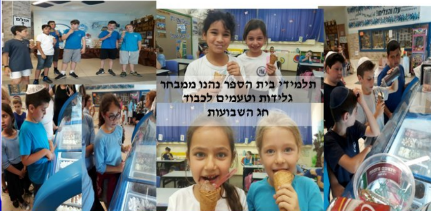
תלמידי בית הספר נהנו ממבחר גלידות וטעמים לכבוד חג השבועות