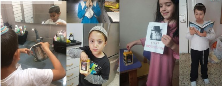
חלק מהתלמידים שהשתתפו במבצע. כל המשתתפים יזכו בפרסים!