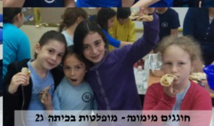
חוגגים מימונה - מופלסות בכיתה ג'