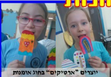
יוצרים "ארטיקים" בחוג אומנות