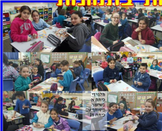
תלמיד כיתה א' בשיעור משותף עם כיתה ד'