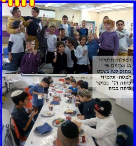
למעלה- תלמיד 11 מכינים שי מתוק לטו בשבט למטה- תלמיד כיתה ד' בבוקר כיתה בית