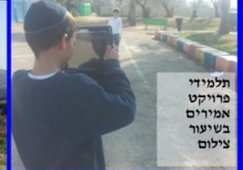
תלמידי פרויקט אמירים בשיעור צילום