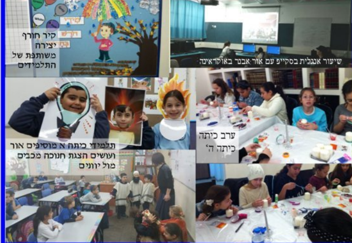
קיר חורף יצירה משותפת של התלמידים