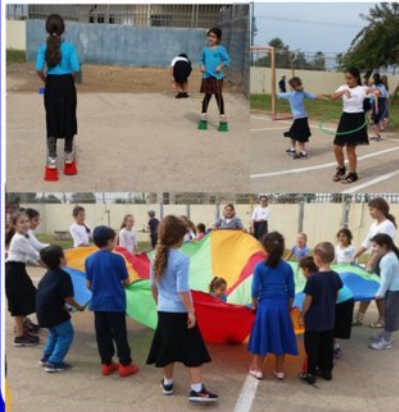
תלמידות כיתה ו' מפעילות הפסקה פעילה לתלמידים עם המורה לספורט