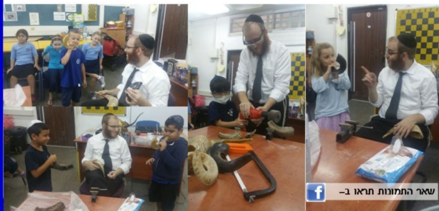
שאר התמונות תראו ב-f