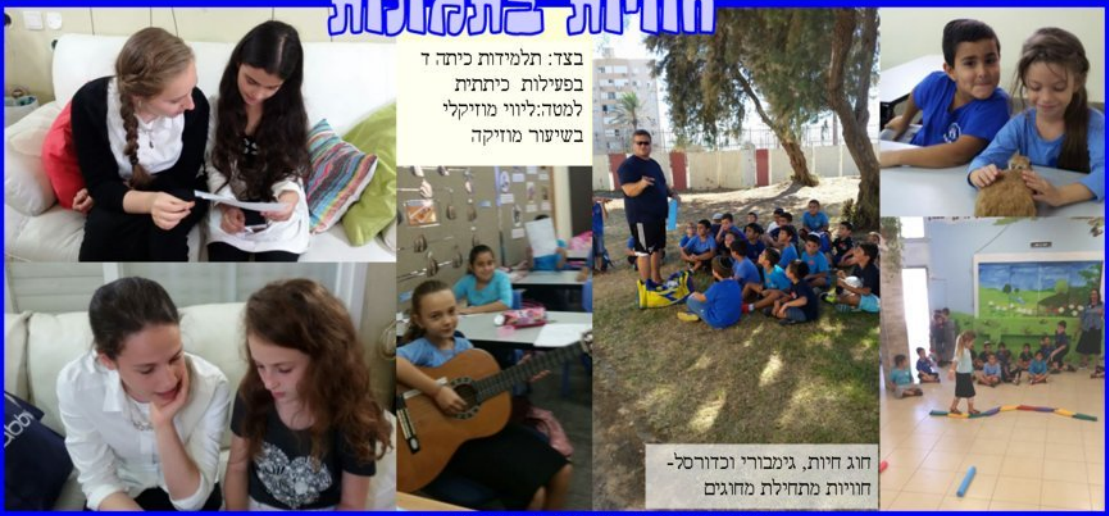
בצד: תלמידות כיתה ד בפעילות כיתתית למסדה: ליווי מוזיקלי בשיעור מוזיקה