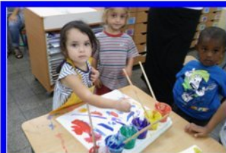
ילדי הגן הצעיר מתאקלים ונהנים