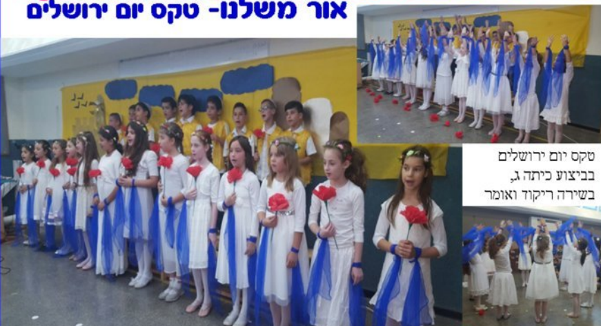
טקס יום ירושלים בביצוע כיתה ג, בשירה ריקוד ואומר