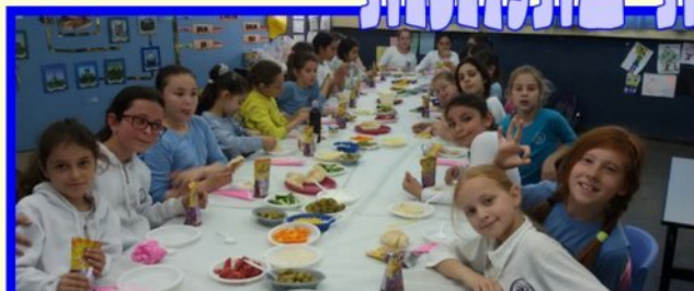
למעה - בוקר כיתה ז' למטה - מסיבת סיום חומש ויקרא - כיתה ה'