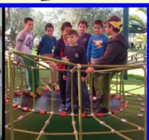
תלמידי ביתות ד בטיול לשטראוס