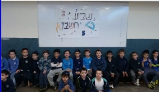
בשבוע מתמטיקה, בשיתוף בנות כיתה ו' העבירו הפעלות, תוכניות, חידה יומית ופרסים למצטיינים