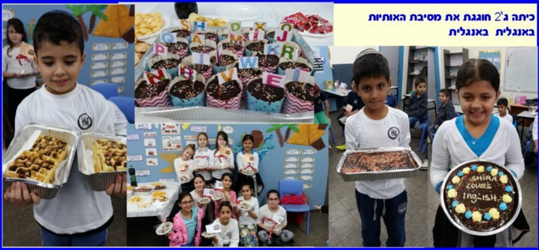
כיתה ג'2 חוגגת את מסיבת האותיות באנגלית באנגלית

עוד תמונות באתר בית הספר וב העיתון אופוס בפורמט ציבסון כאני or-avner.net