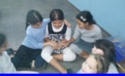
כיתה ד1 בפעילות בשיעור בשיעור 11 הביאו תלמידים את חיות המחמד שלהם