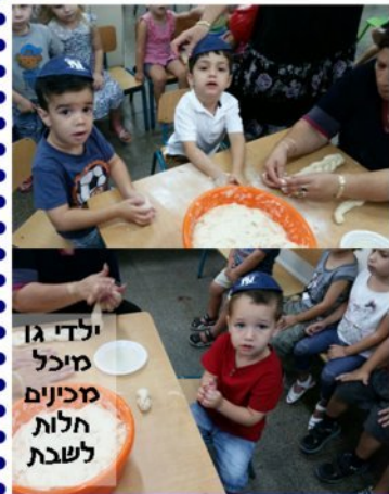
ילדי גו מיכל מכונים חלות לשבת