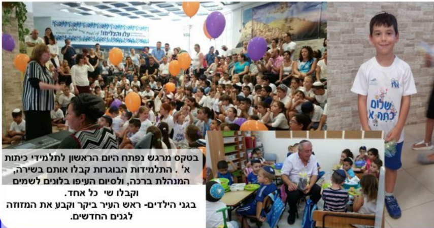
בטקס מרגש נפתח היום הראשון לתלמידי כיתות א'. התלמידות הבוגרות קבלו אותם בשירה, המנהלת ברכה, ולסיים העיפו בלונים לשמים וקבלו שי כל אחד. בגני הילדים- ראש העיר ביקר וקבע את המזוזה לגנים החדשים.