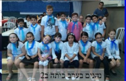
נהנים בערב כיתה ב2

עוד תמונות באתר בית הספר וב f העיתון אופוס בפורמט צ'כסון באג or-avner.net