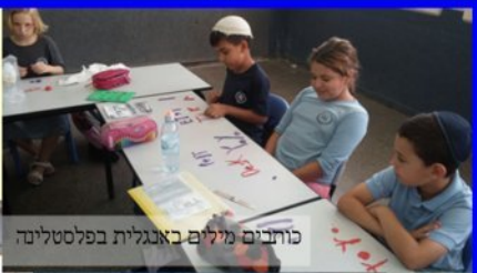
כותבים מילים באנגלית בפלסטלינה