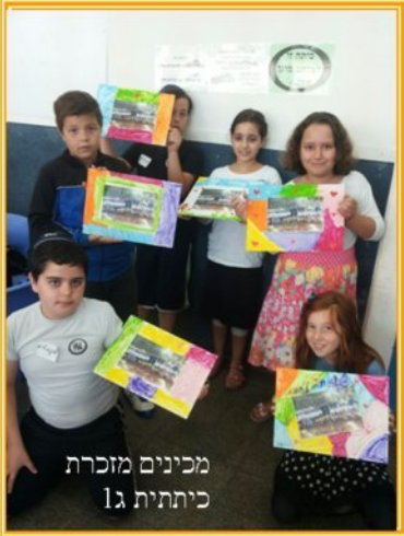
מכינים מזכרת כיתתית ג1