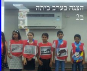
הצגה בערב כיתה ב2