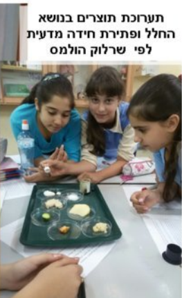
תערוכת תוצרים בנושא החלל ופיתרת חייד מדעית לפי שרלוק הולמס